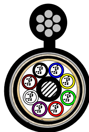
48C (6 心簇) 96C (12 心簇)